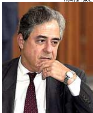
Brindeiro deixa servidores da casa em segundo plano

Tal projeto, apelidado de "Trem da Alegria", foi uma saída que o Procurador-Geral encontrou para beneficiar pessoas ligadas a ele logo este ano,