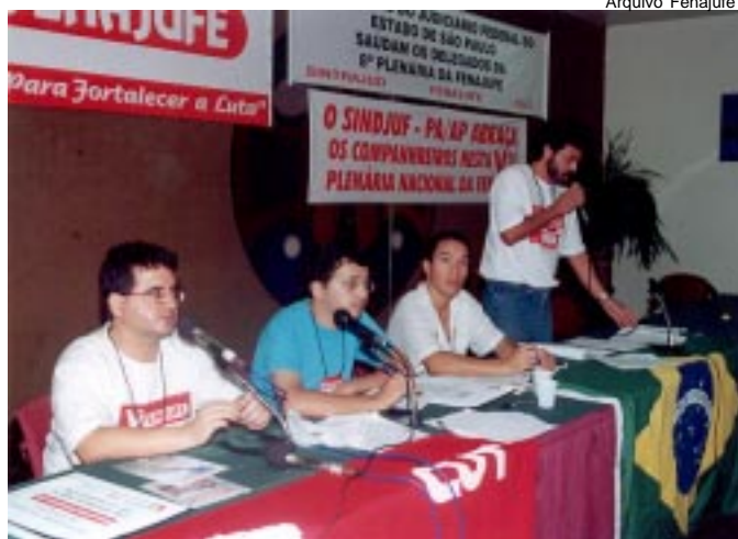
Diretores da Fenajufe conduzindo os trabalhos de mesa na 8ª Plenária Nacional, em Belém/PA. Categoria começava a definir a luta pela revisão dos PCS.